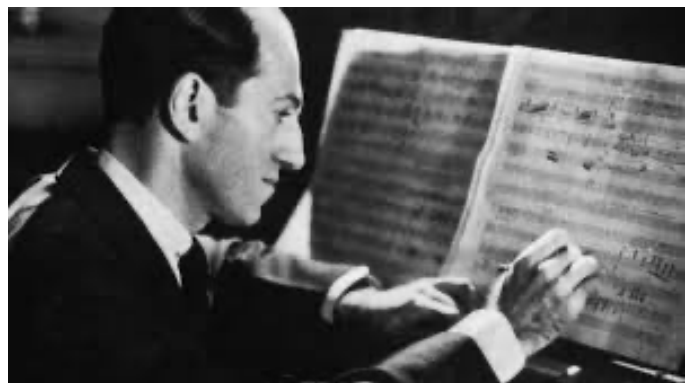
George Gershwin aan het componeren

Jullie mogen zelf het lied Summertime met het orkest mee gaan zingen als jullie de voorstelling De Geheime Sleutel van Gershwin bezoeken!